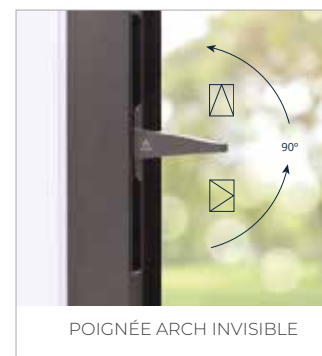
POIGNÉE ARCH INVISIBLE